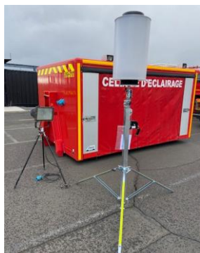
CELLULE ECLAIRAGE : CBN