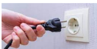
ALIMENTATION sur SECTEUR