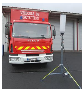
VPRO : SFO / RSR / GZL