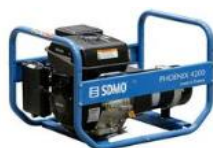
ALIMENTATION sur GROUPE ELECTROGENE